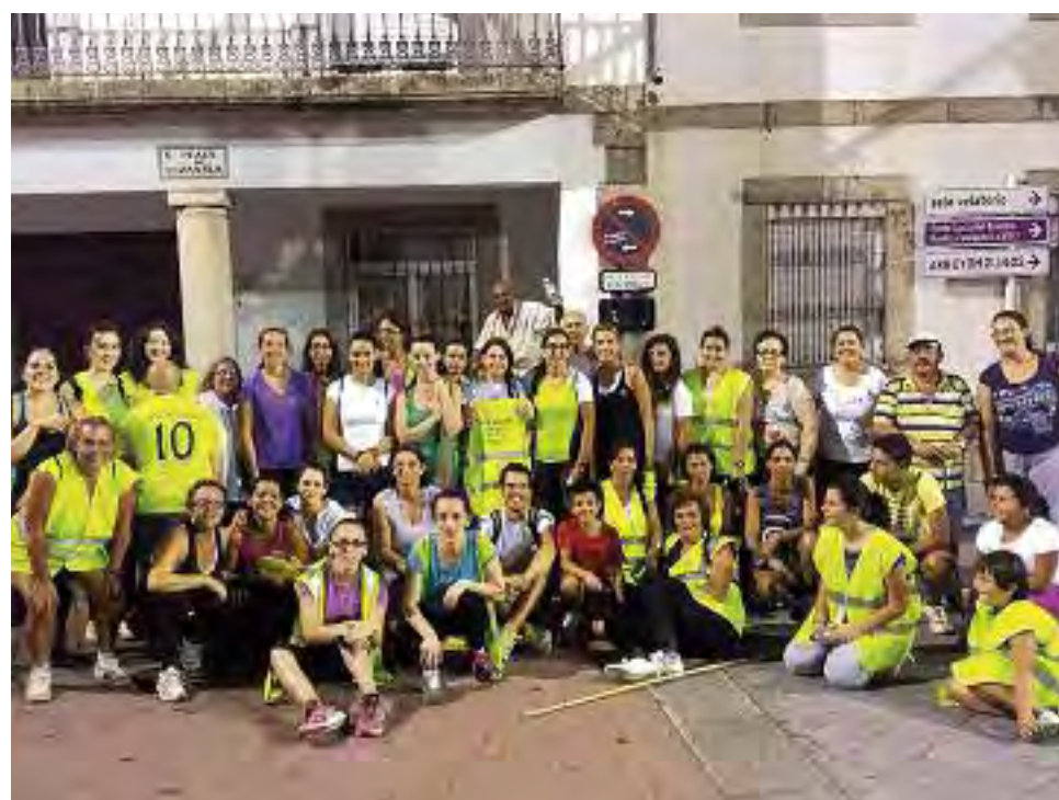
Arriba, concurso de carrozas y procesión en el día de la romería. Sobre estas líneas, representación teatral de "Los Gemelos". Debajo, participantes en la primera ruta nocturna.