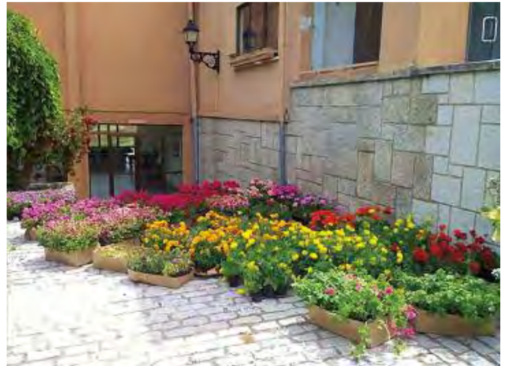
Los ocho alumnos-trabajadores de la rama de jardinería han llenado las calles de Montánchez de petunias, geranios, margaritas, plantas aromáticas, claveles y crisantemos.

los aprendices de jardinería han plasmado su impronta y su saber hacer en el ramo.