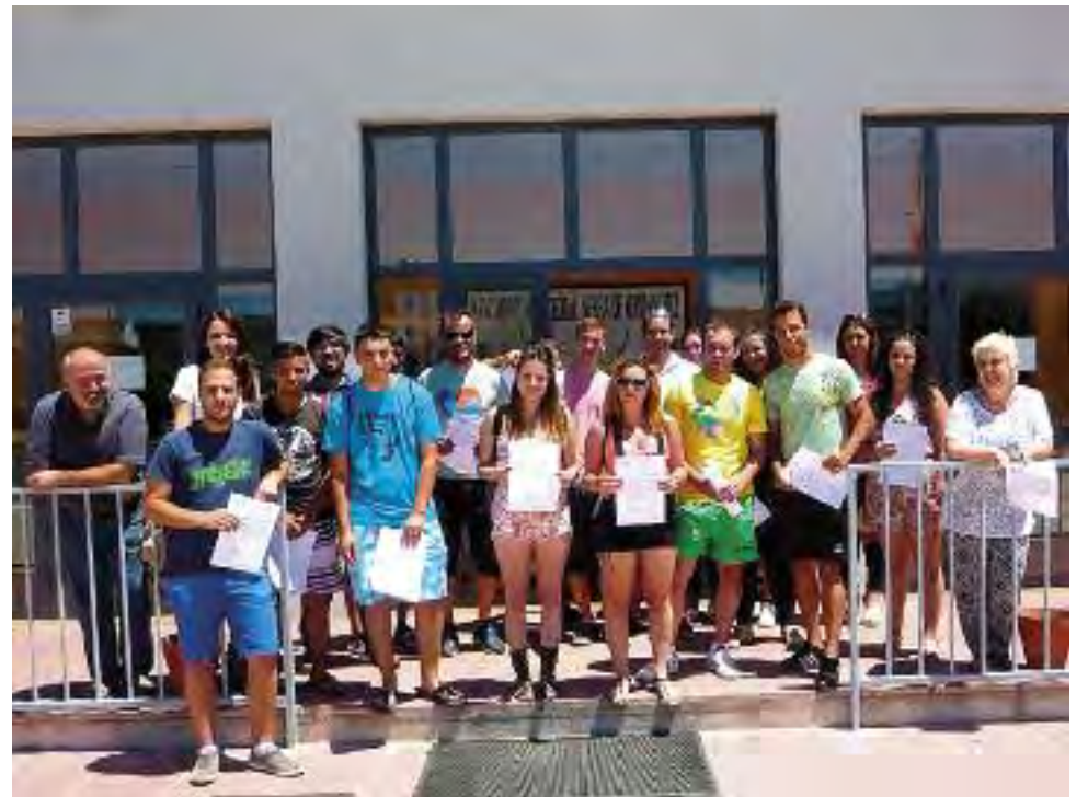
Alumnos y alumnas de los PCPI impartidos en la sede de la Mancomunidad.

Con ello pretendemos favorecer y promover las relaciones familiares y sociales. Así como sensibilizar la importancia de la siembra de árboles para la mejora del medio ambiente y sostenibilidad de la comarca. También se pretende enseñar a las familias a promover actividades conjuntas que rompan su rutina y sirva como alternativa de ocio familiar responsable.