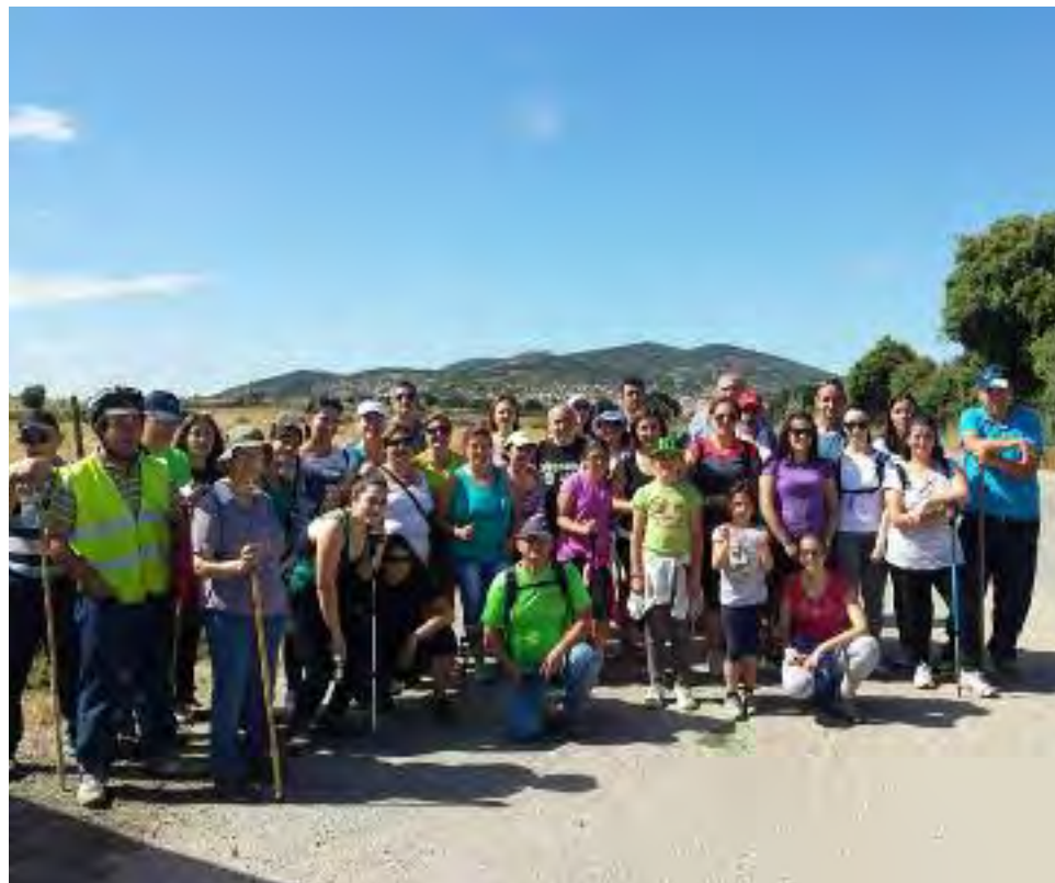
Arriba, en la merienda saludable. Sobre estas líneas, participantes de la tercera ruta diurna. Abajo, preparados para la charanga popular, y nuevas farolas en la pista desde El Caleñar a La Fora.