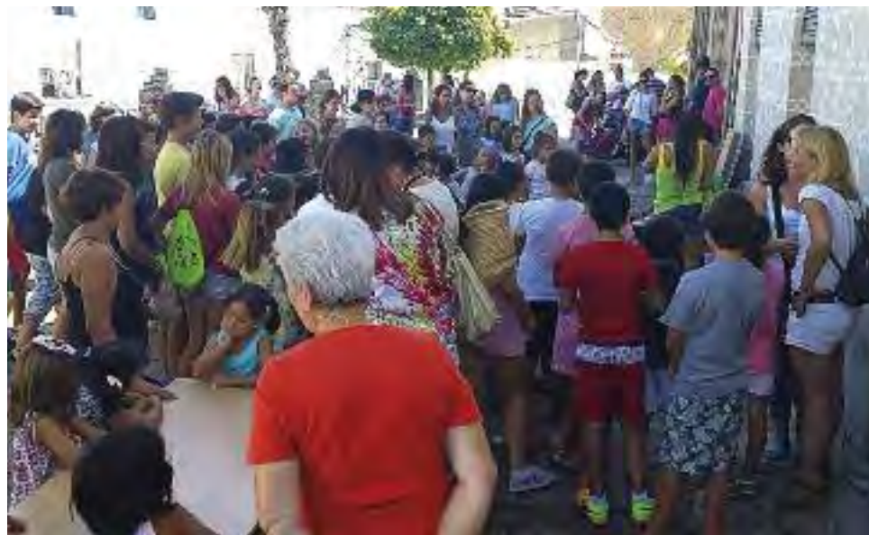
De arriba a abajo y de izda. a dcha., actividades de los Veranos Lúdicos en Aldea del Cano, Plasenzuela, Valdefuentes, Ruanes y Albalá.

Para finalizar la mañana los niños y mayores conocían a nuestro particular burrito Platero. Este año se celebra el 100 aniversario de ‘Platero y yo’, y hemos querido emular a Juan Ramón Jiménez utilizando la descripción que en el primer capítulo aparece de su apreciado Platero. De este modo tras conocer a nuestro Platero y describirlo entre todos, descubriendo que era muy similar nuestra descripción con la que hace el escritor en su libro, los más pequeños coloreaban según