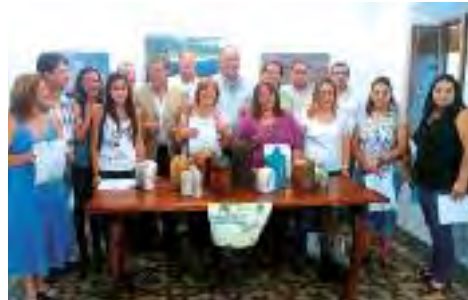
Los y las participantes del curso recogen sus diplomas y muestran sus trabajos.

El pasado 24 de julio se celebró, en la sede de la Fundación VanderLinde, el acto de clausura del Curso de Formación en Artesanía Cerámica Creativa, impartido desde marzo hasta julio de 2014.