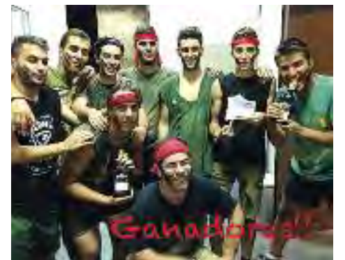
Foto grande, cocido solidario. A la izda., desayuno saludable durante la Semana Cultural y debajo evento benéfico (ASION). Sobre estas líneas, ganadores de la Gymkana.

Quintos, que año tras año siguen recorriendo las calles del pueblo cantando canciones populares de nuestro municipio y quitando las cortinas de aquellos despistados que han olvidado recogerlas.