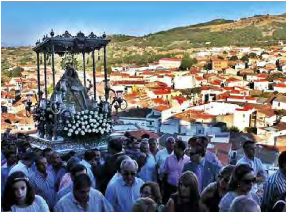
Unas treinta peñas participan por vez primera en el día de las peñas en las fiestas patronales de la Virgen de la Consolación.