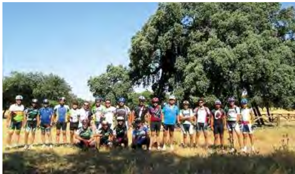
El recorrido, de unos 50 kms, discurrió por distintas zonas de la comarca, pasando por Montánchez (inicio y final), Zarza de Montánchez, Torre de Santa María y Valdefuentes.