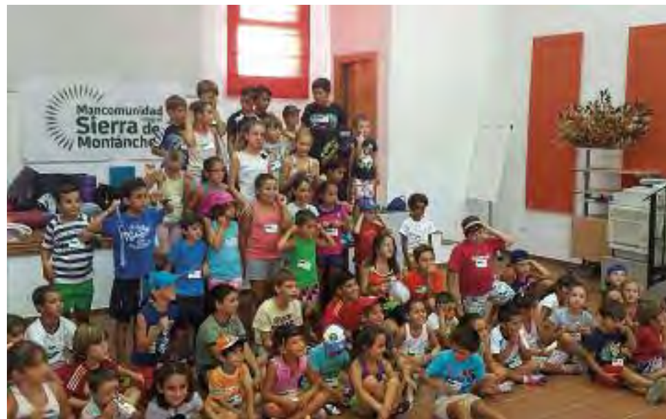
Las fotos recogen diferentes momentos y actividades desarrolladas con los niños y niñas en ambos campamentos de la Mancomunidad.

La comida fue elaborada por el alumnado del Programa Aprendizext "Sierra de Mon-