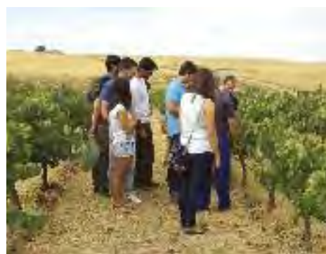
Demostración de actividades de Atención sociosanitaria, en la jornada de puertas abiertas de Aprendizext Robledo, y visita a una viña ecológica.

tes que las lluvias. De esta forma, nos aseguramos una calidad óptima del fruto.