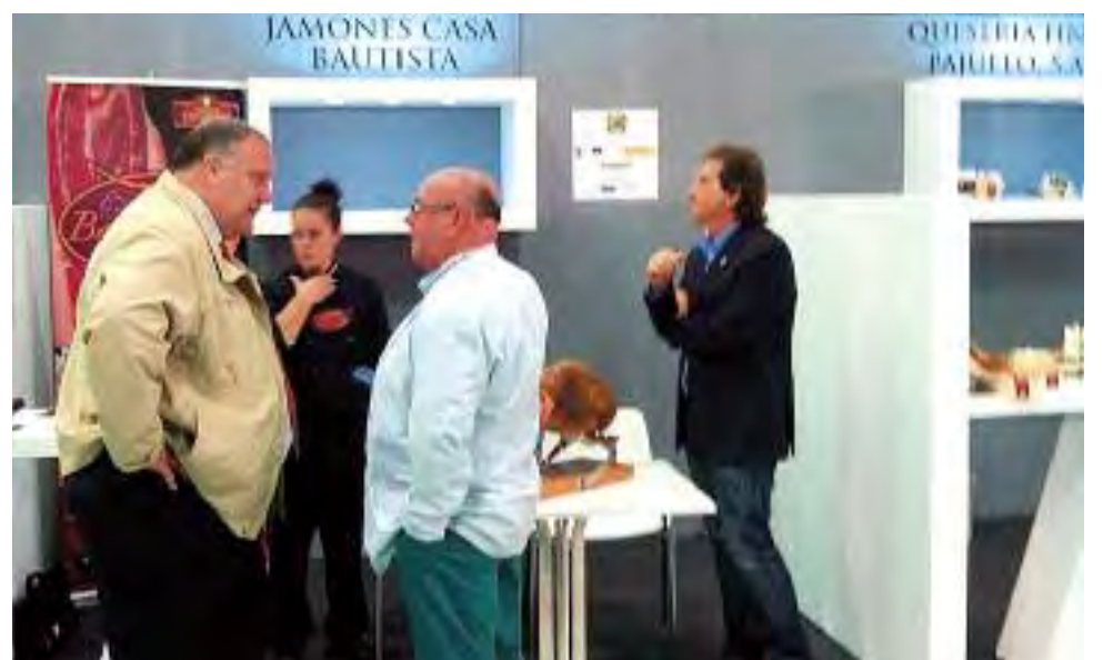
Industriales del sector junto a miembros de la Junta Directiva de Adismonta en FIAL 2014.

http://www.canalextramadura.es/node/95487