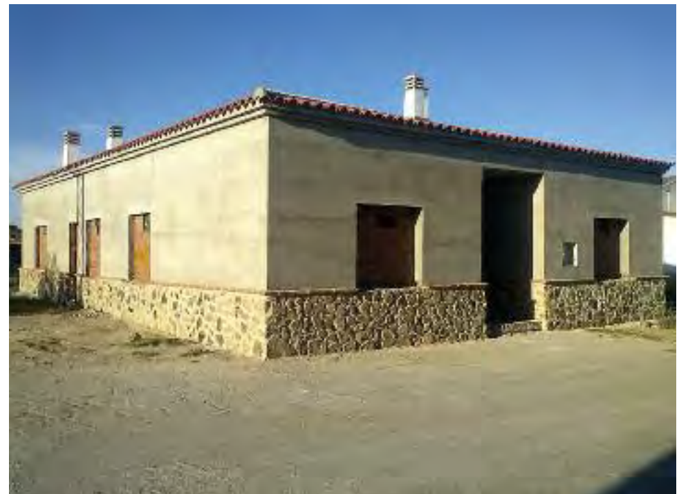
Segunda fase de las obras del Centro de Día y residencia de ancianos. Debajo, el parque periurbano de Santa Ana, de reciente creación.