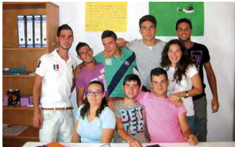
Alumnos de Aprendizext 'La Morra', de Arroyomolinos.