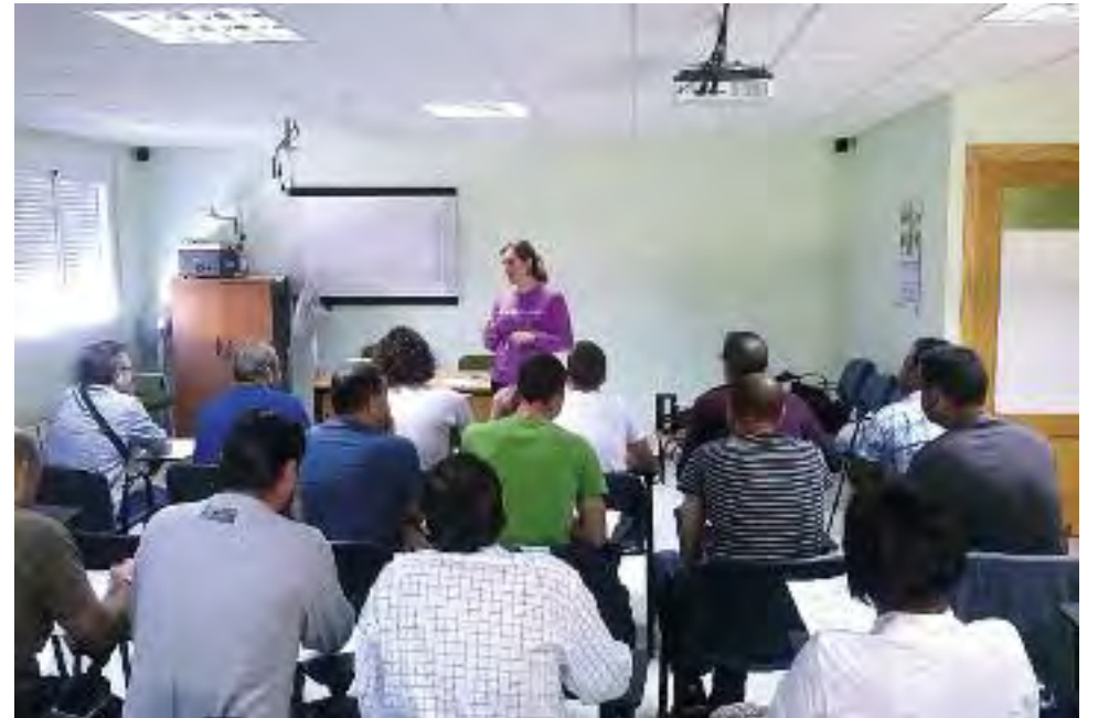
Charlas informativas en diferentes municipios de la Mancomunidad sobre las campañas que desarrolla el Consorcio Extremeño de Información al Consumidor.

También aboga por el fomento de un consumo responsable de material escolar, pues “ahorrar recursos naturales y dinero serán