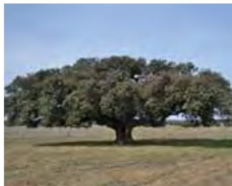
Arriba, alumnos de jardinería del proyecto Aprendizext. Sobre estas líneas, encina 'La Solana', en el término de Valdefuentes. Abajo, xerojardín de la Mancomunidad.

encias del mundo clásico. Los aqueos, que constituían las más antigua de las familias griegas, celebraban bajo una encina sagrada sus reuniones comunes en las que se tomaban las decisiones más importantes.