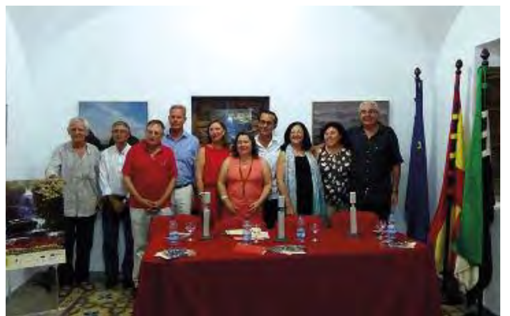
Acto de entrega de premios Diálogo de Culturas, 2014.

Es sin duda una curiosa ruta que busca recordar ese trayecto a pie que anduvieron los montanchegos cargados con el santo hasta Torre de Santa María.