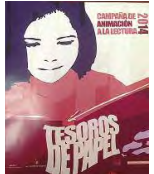
Las imágenes recogen una muestra de las diversas actividades organizadas.