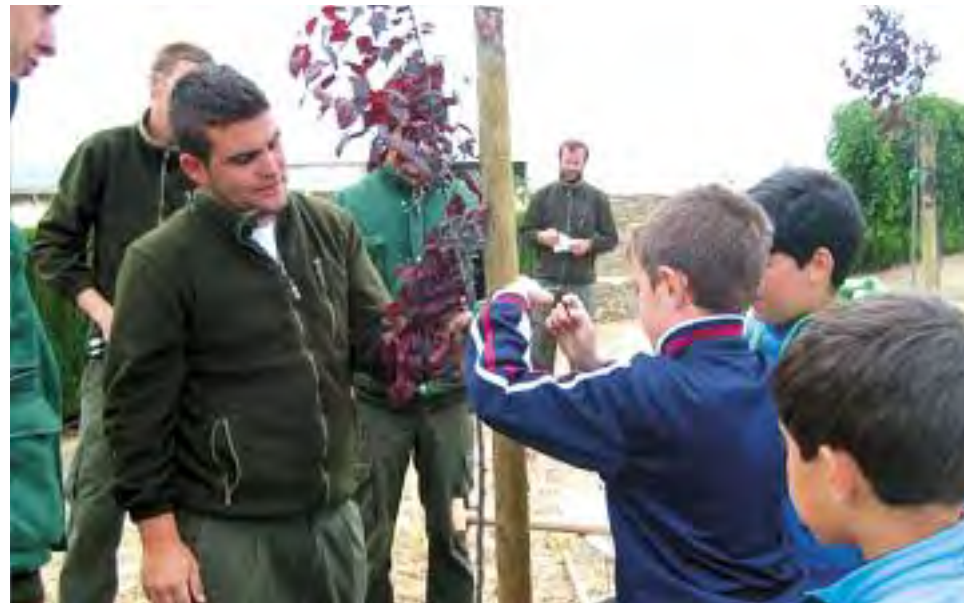
En el taller 'La importancia de los árboles'.

La buena acogida de la actividad por la población, mostrando su gratitud y colaboración con la formación de estos alumnos ha servido de motivación, además de ayuda para detectar algunos casos de alteración de factores de riesgo en personas que lo desconocían, fin principal de este taller. Esperamos poder hacer extensible esta actividad a otras localidades de la comarca en un futuro.