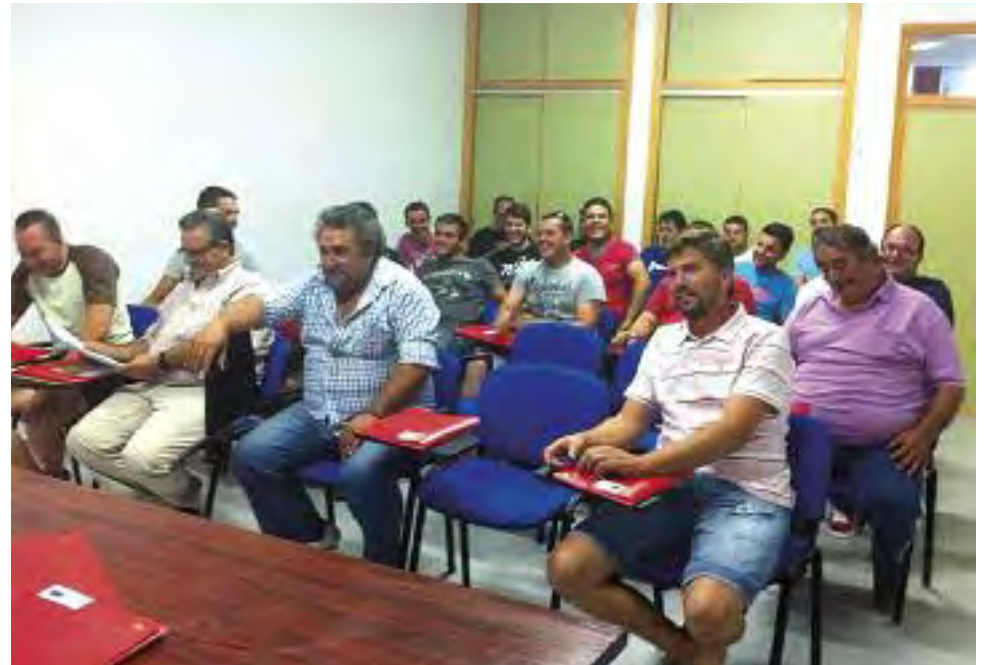
Curso de bienestar animal para transportistas.

El curso de bienestar animal para transportistas ha sido dirigido a conductores o cuidadores de vehículos de carretera que transporten animales domésticos de las especies equina, bovina, ovina, caprina y porcina y aves de corral, para trayectos superiores a 65 km. El curso de bienestar animal ganadero se ha dirigido fundamentalmente