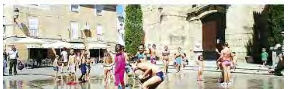
Escenas del grupo de teatro local organizado por la Asociación de Pensionistas y Tercera Edad de Torremocha y fiesta de la espuma infantil.