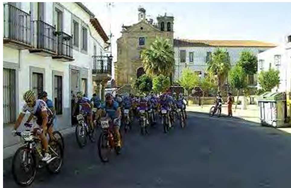
Foto grande, I Copa de Extremadura de Fútbol Sala; debajo, participantes en la III Maratón BTT. A la derecha, obras de acondicionamiento de caminos.

Desde la Consejería de Fomento, Vivienda, Ordenación del Territorio y Turismo, a través de la Dirección General de Carreteras y Obras Hidráulicas se nos ha concedido 59.955 €, para acometer una obra tan importante como necesaria; como es la instalación de nuevas bombas en el aljibe para impulsión y bombeo de agua desde éste al depósito ele-