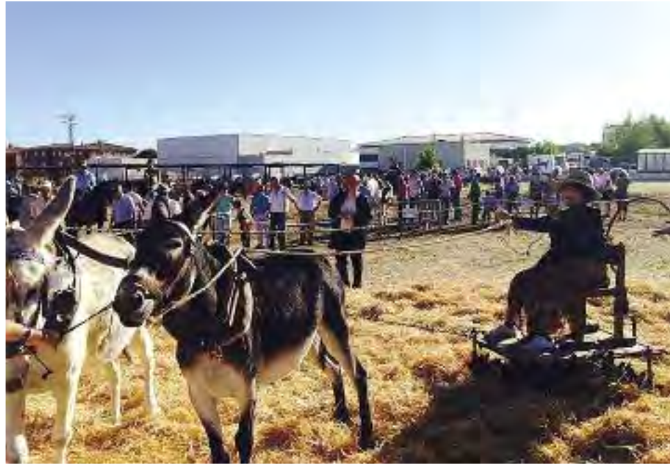
Recreación de la trilla.

Además, hubo diferentes regalos donados por el Ayto. (folletos y productos agroalimen-