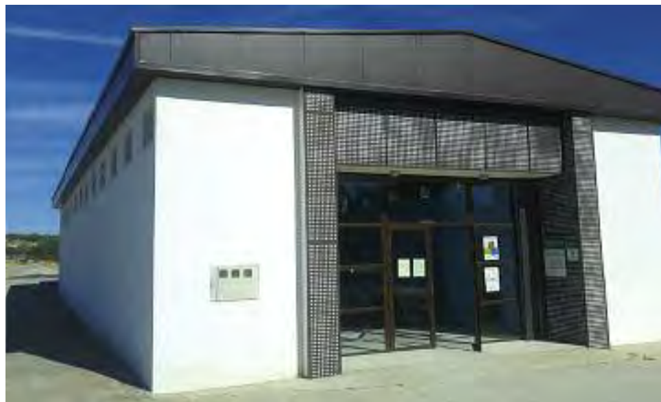
Nueva Casa de Cultura de Salvatierra. Debajo, calle de la feria.

Ya estamos en septiembre y un año más pasaron nuestras fiestas patronales, las de Santiago Apóstol, en julio, y las fiestas en honor a la Patrona, la Santísima Virgen de la Estrella. Un años más las calles de Salvatierra se han llenado de gente, nuestros familiares