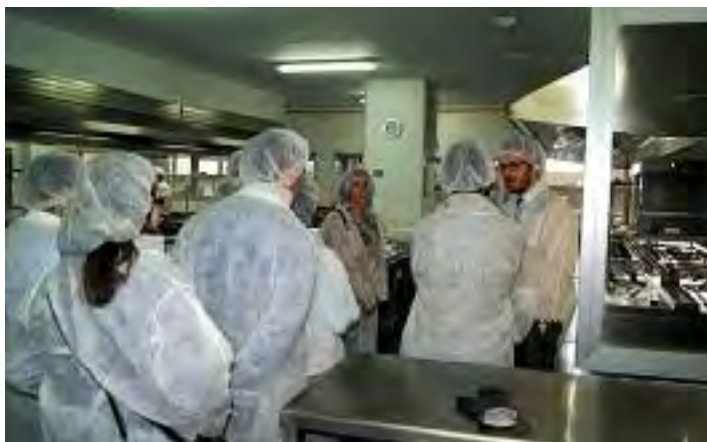
Visita a distintas empresas del alumando de la especialidad de cocina del proyecto Aprendizext de la Mancomunidad.

MANCOMUNIDAD | La primera fase del proyecto Aprendizext en la especialidad de cocina, de la Mancomunidad Integral Sierra de Montánchez, se inició el 26 de noviembre de 2013 y finalizó el pasado 25 de mayo, con un total de 8 alumnos-trabajadores, vecinos de Torre de Santamaría, Albalá, Valdemorales, Almoharín, Salvatierra de Santiago y Sierra de Fuentes.