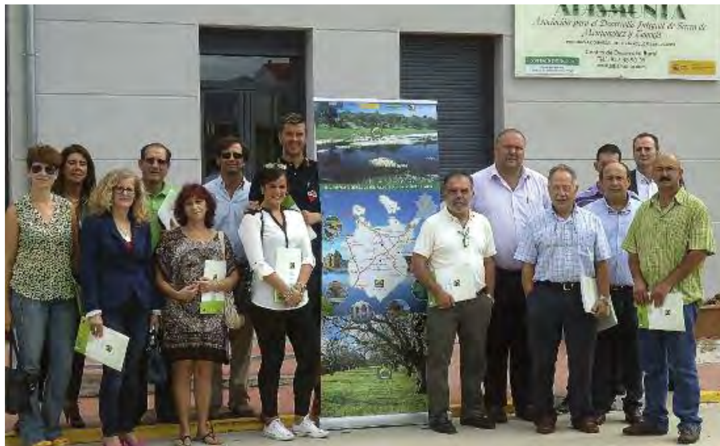
Representantes de Adismonta y de diferentes empresas de la comarca en el acto de la firma de contratos de esta V convocatoria Leader.

Pero la mayor parte de los contratos firmados se corresponde con la medida 312 de Ayuda a la creación y desarrollo de micro-