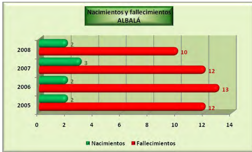
Análisis y gráficos: José L. Bahón; Datos: INE