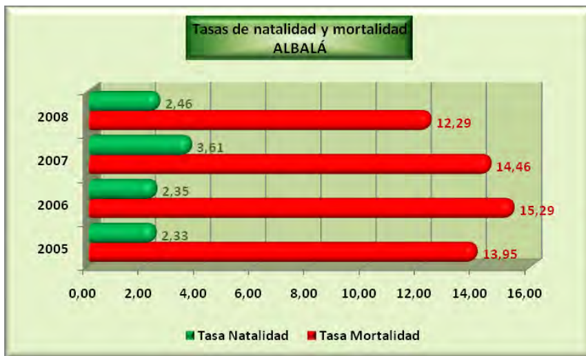
Análisis y gráficos: José L. Bahón; Datos: INE