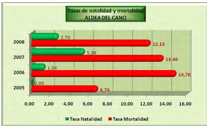
Análisis y gráficos: José L. Bahón; Datos: INE