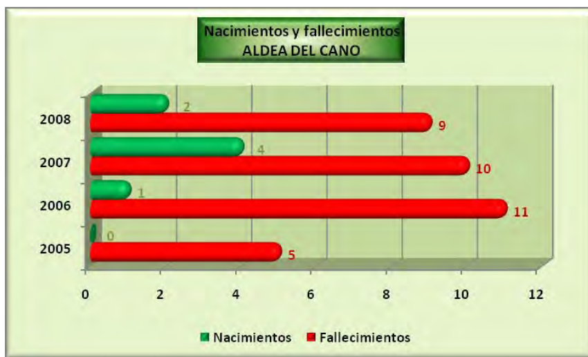
Análisis y gráficos: José L. Bahón; Datos: INE