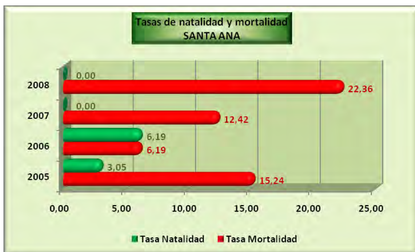
Análisis y gráficos: José L. Bahón; Datos: INE