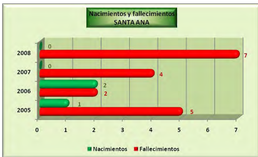
Análisis y gráficos: José L. Bahón; Datos: INE