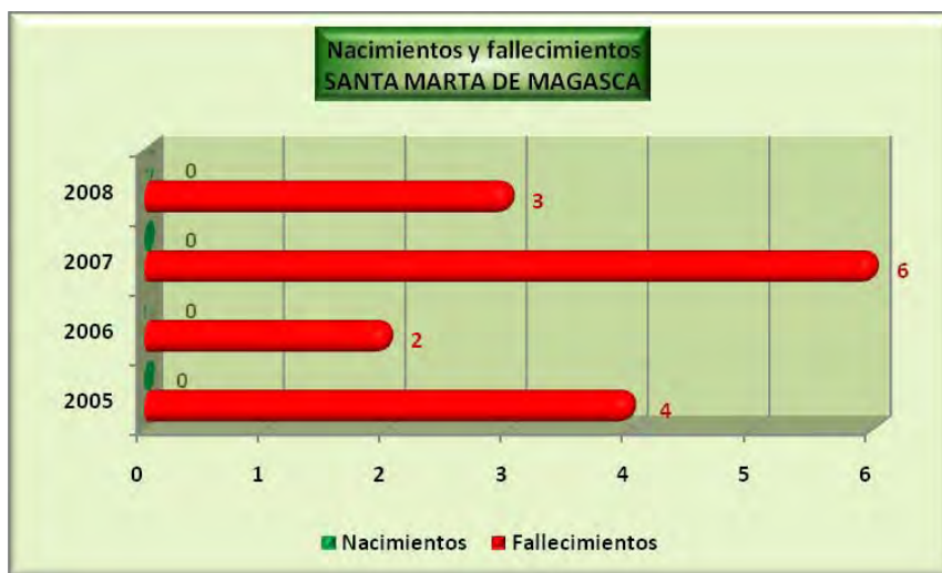
Análisis y gráficos: José L. Bahón; Datos: INE