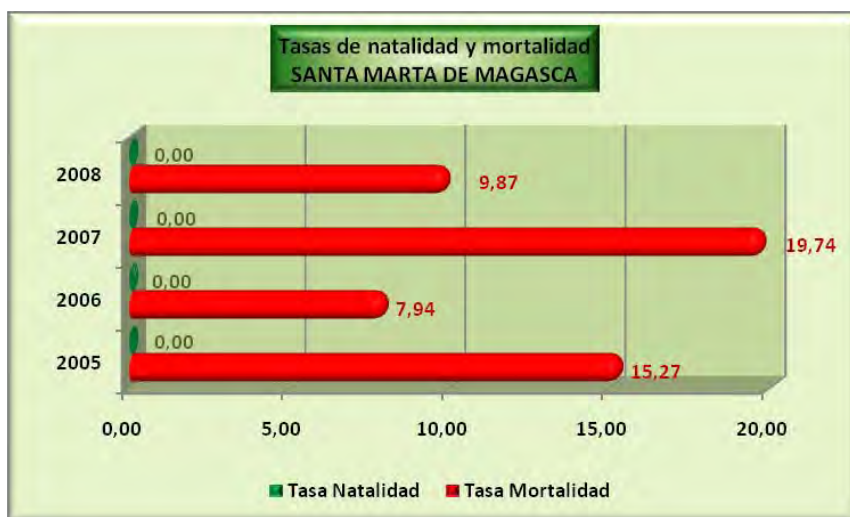
Análisis y gráficos: José L. Bahón; Datos: INE