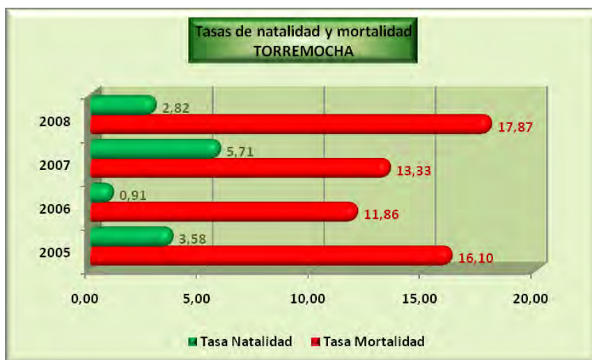
Análisis y gráficos: José L. Bahón; Datos: INE