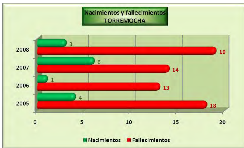
Análisis y gráficos: José L. Bahón; Datos: INE