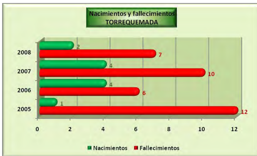
Análisis y gráficos: José L. Bahón; Datos: INE