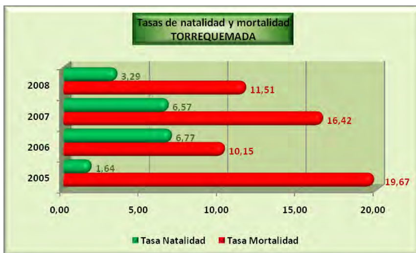
Análisis y gráficos: José L. Bahón; Datos: INE